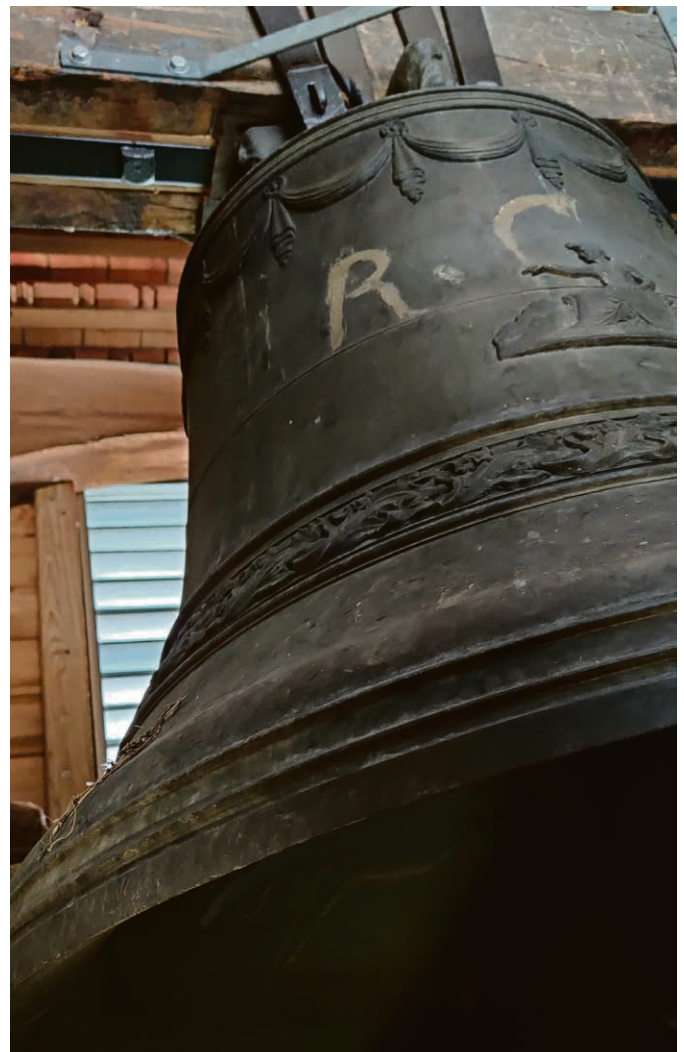
Devinez dans quelle église elle se trouve ?