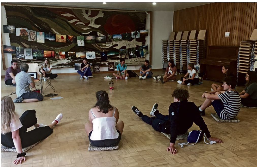
En chemin pour le culte des confirmations.

« ... Que Dieu le Père et le Seigneur Jésus-Christ donnent à tous les frères la paix et l'amour avec la foi. Que la grâce de Dieu soit avec tous ceux qui aiment notre Seigneur Jésus-Christ d'un amour indestructible » (Ephésiens 6, 23 et 24).