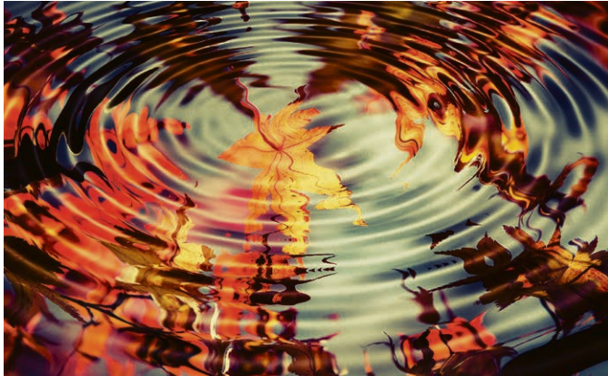
Das Leuchten in Übergängen