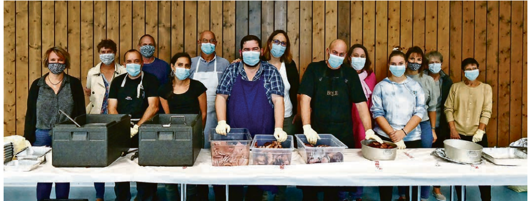
L'équipe d'organisation de la fête des récoltes de Bière est ravie : les gens ont joué le jeu. 150 portions de choucroute à l'emporter ont été vendues !

PIED DU JURA Chaque 2 e mercredi de chaque mois, dès 18h30. Si vous avez envie d'échanger sur un sujet qui touche de près ou de loin à la foi chrétienne, si vous ressentez le besoin de partager une situation lourde à porter, la pasteur Eloïse Deuker se tiendra à votre écoute à la salle paroissiale du 1 er étage de l'église de Bière. N'hésitez pas à prendre rendez-vous avec elle. Lors de l'Espace Ecoute, le chœur de l'église est à la disposition pour un temps individuel de recueillement.