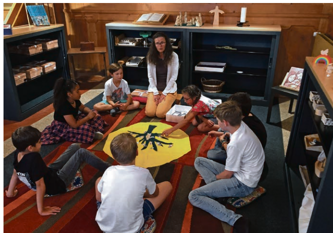
Le lieu spécifiquement aménagé pour la méthode Godly Play.

Le festin et les bénédictions : une boisson et un biscuit sont partagés avant un temps de prière et de bénédictions qui clôturent la rencontre. Voilà en quelques mots le contenu de ces rencontres. Elles seront complétées soit par un temps de pique-nique ou un goûter partagé. Ce qui nous enthousiasme dans cette méthode peut se résumer en un mot : confiance . La confiance que Dieu parle