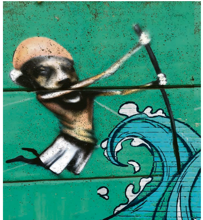
La formation des adultes, pour naviguer en eaux troubles!

Accompagner un être cher quand la communication devient difficile, c'est vivre une réalité qui engendre souffrances et questionnements. Des personnes qui entourent des proches ne pouvant plus s'exprimer comme avant ont émis le désir de pouvoir partager ce qu'elles vivent pour