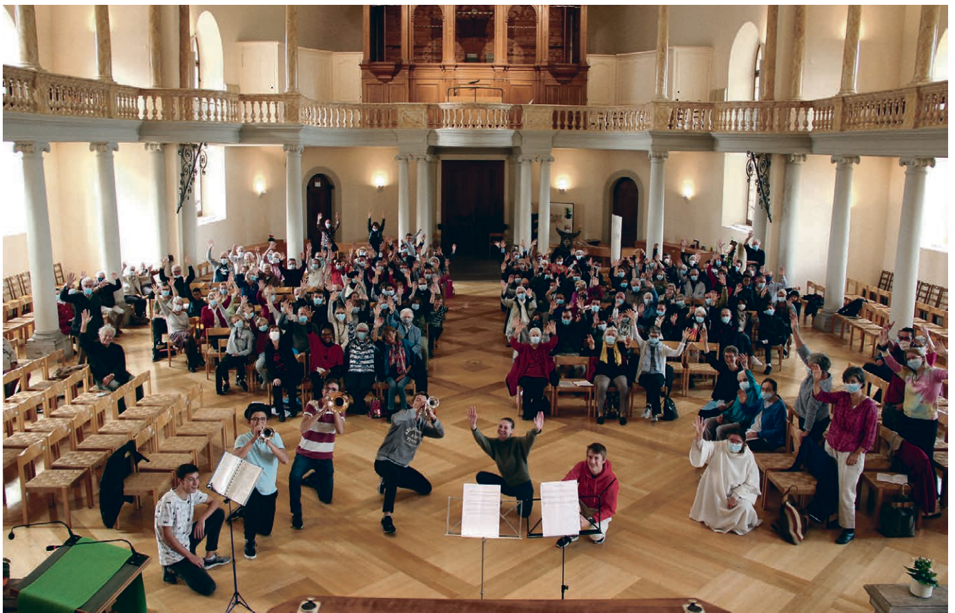
Salutations pour le Rwanda, culte commun aux paroisses de Lonay-Péverenges-Vullierens et Morges-Echichens.