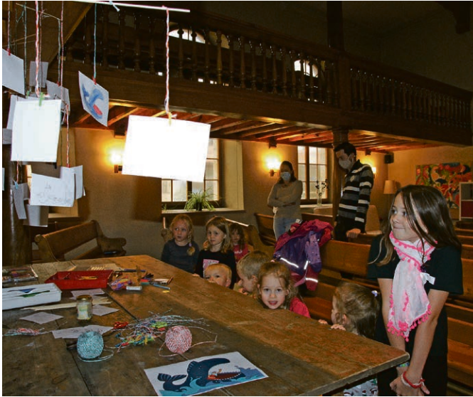
Culte «à 4 pattes». On a confectionné des mobiles avant de passer à d'autres activités et de se promener dans l'église au son de chansons enfantines.

Aubonne en même temps que Bougy-Villars et dimanche 29 novembre à Lavigny et à Aubonne.