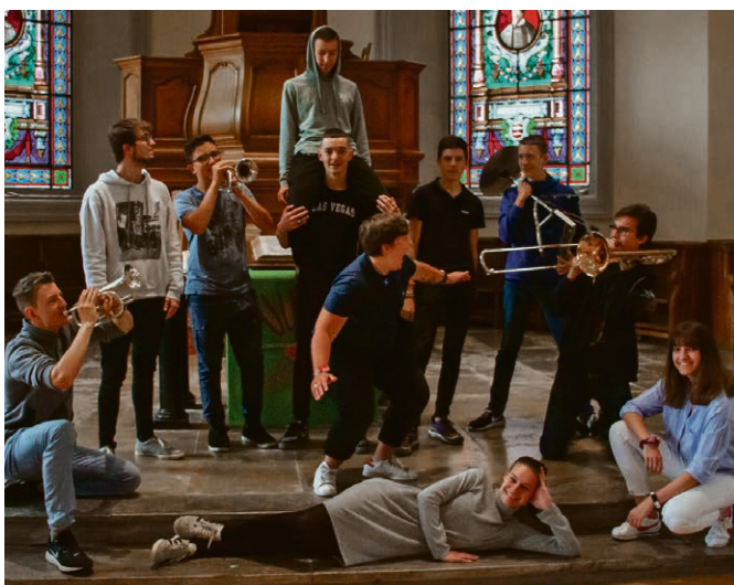
Le groupe de jeunes « çA Joue RM » animera le culte de fête du 15 novembre.

L'AUBONNE Dimanche 15 novembre, 10h, salle polyvalente d'Etoy, culte festif avec « çA Joue RM ? » un groupe de jeunes musiciens de notre région. Ce culte adapté à tous les âges sera l'occasion de donner la bible aux nouveaux catéchumènes. Nous nous réjouissons de nous retrouver pour ce culte festif et rythmé, modèle des célébrations pour notre temps. Thème : Dieu est mon médecin, selon un verset du livre de l'Exode. Un « apéritif Covid » organisé dans le respect des consignes relatives à la pandémie suivra la célébration. Ventes de salé, de sucré et de vin pour soutenir notre paroisse.