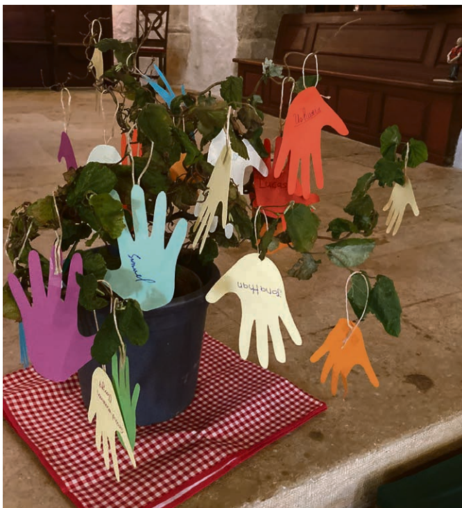
« L'arbre aux mains » des enfants et des parents de nos rencontres d'Eveil à la foi.