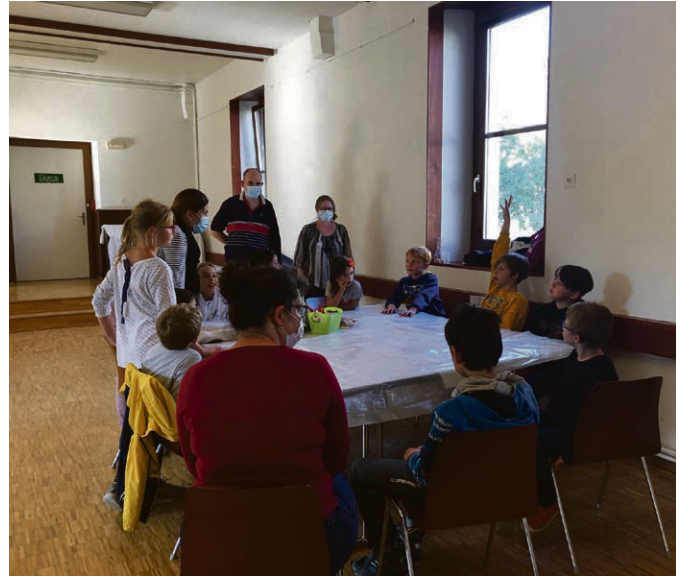
En route pour une nouvelle année de KT!

Les jeunes qui vivront le culte de bénédiction le 8 novembre se retrouvent samedi 31 octobre de 9h30, à 17h, à Ro-