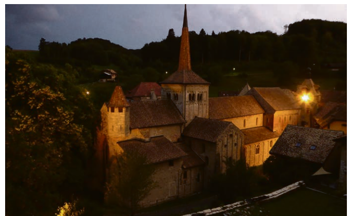
Dimanche 29 novembre ensemble à Romainmôtier.

C'est à partir de la splendide annonce du rameau sortant de la souche rabougrie de Jessé que nous vivons ce culte régional avec reconnaissance et solennité. Je ressens que nous avons profondément besoin de nous tourner ensemble vers Dieu comme des enfants vers leur Père. Pour retrouver ancrage en l'invoquant. Pour élargir nos horizons en le louant. Pour laisser son pardon diluer nos fardeaux. Pour intercéder ensemble. Besoin de poser un acte fort. De nous mettre d'aplomb spirituelle-