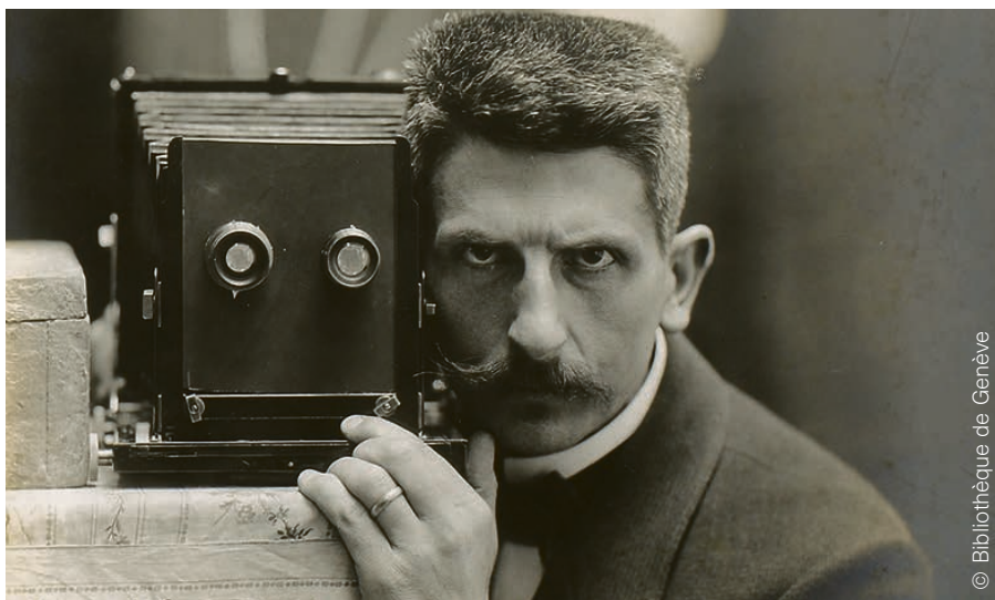
Autoportrait à l'appareil binoculaire, Fred Boissonnas, 1900.

« Après la Grèce, Fred Boissonnas cherchera d'autres voies pour repartir en Méditerranée, raconte l'historienne. Il était fasciné par des projets qui permettaient de restituer un paysage à une histoire. » Ainsi part-il sur les traces d'Homère. Il photographie les différents lieux qui auraient inspiré le récit des péripéties