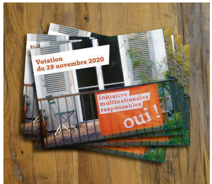
Initiative pour des multinationales responsables.