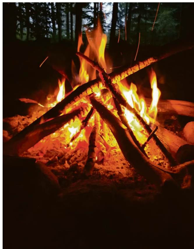
La lumière de Noël.

« Les vivants ferment les yeux des morts et les morts ouvrent les yeux des vivants. » ▀ Anonyme